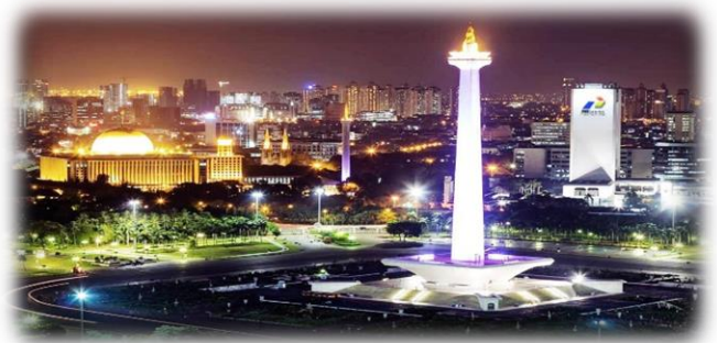
インドネシア百景その④ ≪(モナス)モニュメント・ナショナル≫ インドネシアのジャカルタにあります

105-0013 東京都港区浜松町 2-8-14 浜松町 TSビル 7F インター協同組合 TEL:03-5408-3611 FAX:03-5408-3612