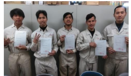
茨城県 2019年3月配属 アンガ、レギ、デデ、シヨリキン、アフリ(溶接)