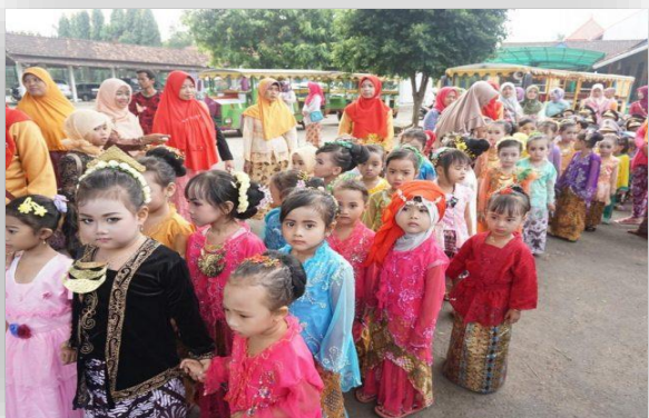
インドネシア百景その⑤「カルティニデー(4月21日)」