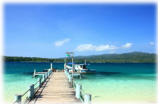
◀ ウジュン・クロン国立公園の美しい海 ▶

(2)適切な技能実習計画の策定等 技能実習計画は雇入れ後の年次に応じて実習期間を定めていますが、年次有給休暇を取得することを前提とした日程で計画を策定してください。