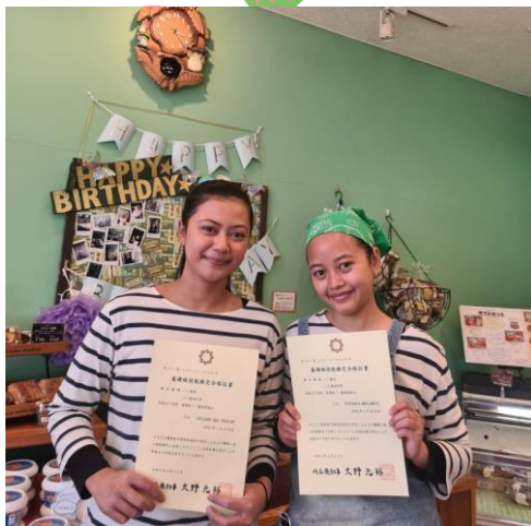
埼玉県企業 2022年5月配属 パン製造