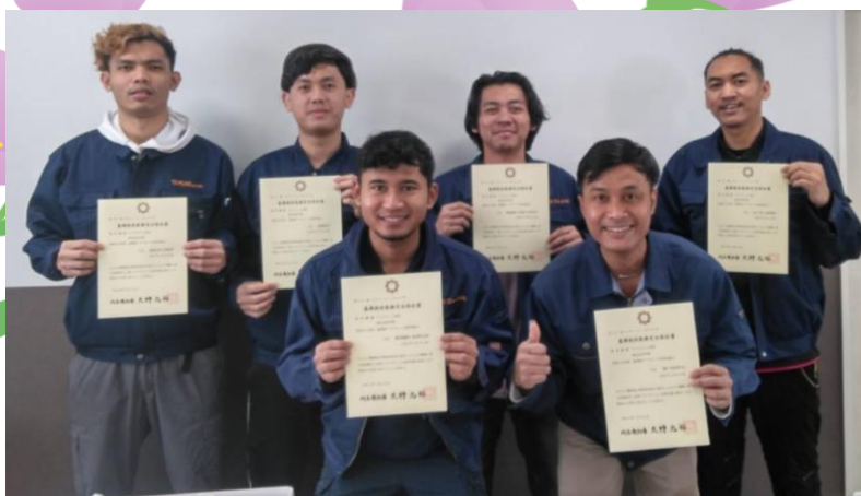
埼玉県企業 2022年4月配属 射出成形