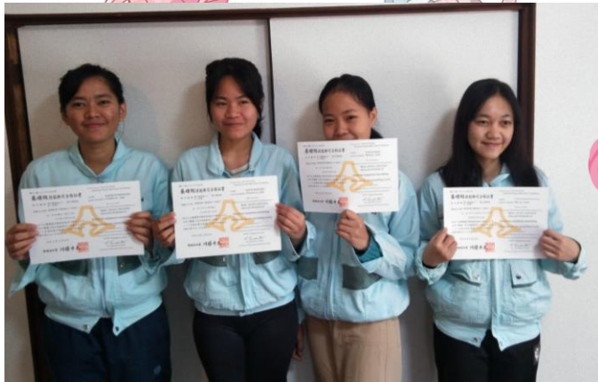
静岡県企業 2022年7月配属 電子機器組立て