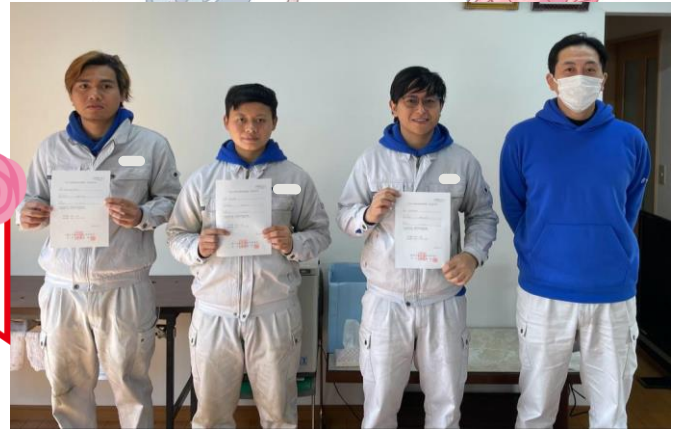
群馬県企業 2022年8月配属 半自動溶接