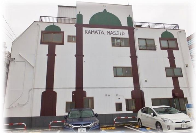
蒲田モスク(蒲田マスジ)

「技能実習制度運用要領」の改正に伴い、配属時の必要書類として『 技能実習の期間中の待遇に関する重要事項説明書 』という書類が新たに追加になります。『技能実習の期間中の待遇に関する重要事項説明書』とは、実習中の待遇・入国後講習中の待遇・実習先変更についての説明が記載されている文書になります。統一して6月配属の実習生より、新たに配属ファイルに追加いたします。