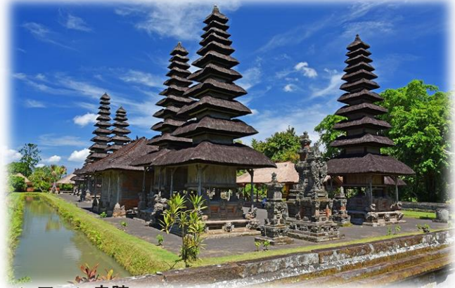
タマンアユン寺院