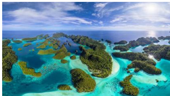
ラジャ・アンパト島々、パプア、インドネシア