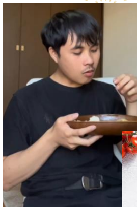
🏆1位🏆 埼玉県企業にて 2号実習中の エギさん

3名の実習生には、組合よりクオカードを贈呈いたします★★毎日仕事で疲れていても、自炊をしたりお弁当を作ったり実習生が頑張っているということを私たち組合職員もさらに知ることができたいい機会になりました。