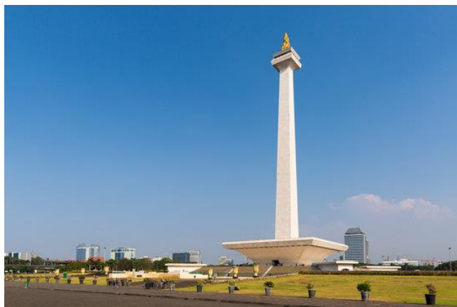
MONUMEN NASIONAL (MONAS/モナス) インドネシアのジャカルタにある国家独立記念塔

インドネシアの首都ジャカルタのムルデカ広場の中心にそびえ立つモナスは、「国家独立記念塔」の名称です。モナスのあるムルデカ広場は、「独立広場」を意味しています。ジャカルタにある大統領官邸では、毎年8月17日に盛大な独立記念式典が行われています。独立記念日は祝日のため、会社や学校は休みとなり毎年各地でイベントやパレードなども行われているそうです。独立記念日は普段と違うジャカルタの雰囲気、インドネシアの人々はみんな楽しそうに独立を祝います。日本も建国記念日がありますが、インドネシアの過ごし方と大きく違いますね！！ぜひ、実習生にインドネシアではどのような過ごし方をしていたのか聞いてみてくださいませ。