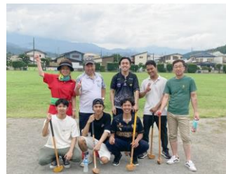
大会に参加時のグループ写真

賞のこと以外、一番印象に残ったのは賞を待っている間に、日本人の皆さんが、自発的にすぐ動いて、協力して用具を片づけたり、ゴミを拾ったりしていたことです。インドネシアでは見たことないです。そして、良かったことは大会がきっかけで、近所の人々と知り合いになって、毎朝通勤の途中でいつもお互いに挨拶できるようになりました。