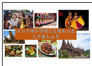
作成したパワーポイント